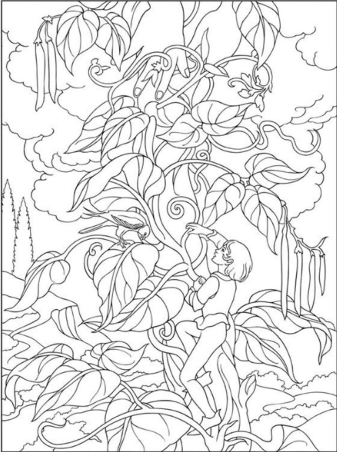
9. Jack and the Beanstalk