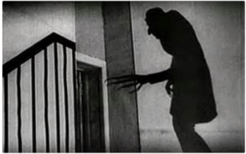
Nosferatu le vampire, un film de Friedrich Wilhelm Murnau, 1922

Dracula est un roman de l'écrivain irlandais Bram Stoker publié en 1897. Il raconte l'histoire du Comte Dracula, un vampire, c'est-à-dire un être immortel qui se repaît du sang des vivants et les transforme à leur tour en vampires.